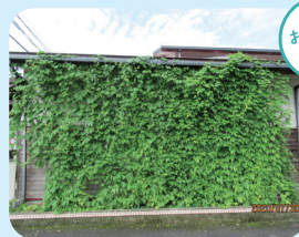
地福保育園の園舎でのグリーンカーテンの取り組み。(2020年)

熱中症や冷たいものの食べ過ぎ・飲みすぎには十分に注意しましょう。外気温や湿度、体調などに合わせて無理のない範囲で、冷やしすぎない室温調整をお願いします。