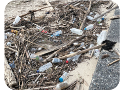
山口市 やまぐちし の美濃ヶ浜 みのがひら の海岸 かいがん には、たくさんのプラスチックごみが流 なが れ着 き ている。

プラスチックごみを分別 ぶんべつ せずに捨 す てると、処分 しょぶん する時 とき 、CO 2 がたくさん出 で ます。また、ポイ捨 ぽいす てされ雨 あめ や風 かぜ で海 うみ に流 なが れると海洋プラスチックごみ、とても小さなマイクロプラスチックになり、魚 いし がエサと間違 まちが えて食 た べてしまうなどの問題 もんだい も深刻 しんこく 。レジ袋 れじふく は断 ことわ る、ペットボトルよりマイボトル(水筒)、詰め替え製品 つめかえひん を選ぶ、ちゃんとリサイクルするなど、地球 ちきゅう のために簡単 かんたん にできることがあります。