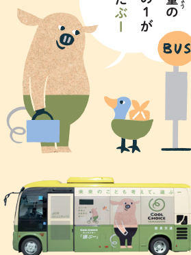
山口市コミュニティバスでは、選べるラッピングバスが走っている。

通勤や通学、旅行、ちょっとした外出に、マイカー以外の選択肢を考えてみませんか？ 山口市は全国比較でガソリン購入量が最多という統計もあります。大人数が一度に乗れる鉄道やバスなら、みんながマイカーを利用するよりもCO 2 排出量を減らせます。いつもはマイカーで行く場所にも、鉄道やバスでお出かけすれば、ちょっとした旅行気分になれるかもしれません。