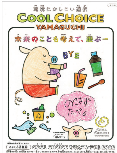
優秀賞 古屋 心遥 (6歳) 山口大学教育学部附属幼稚園